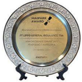
MAIPARK AWARD 2022