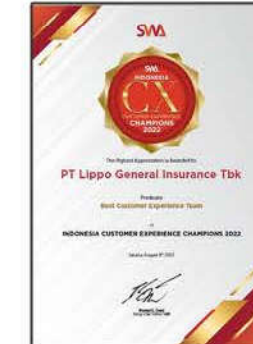
SWA Indonesia 2022