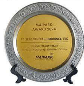
MAIPARK AWARD 2024