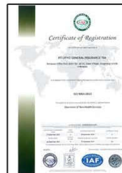
ISO 9001 : 2015