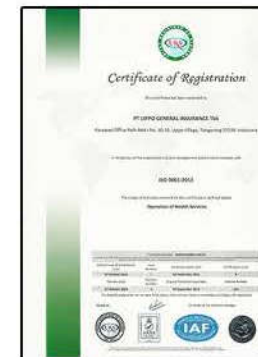
ISO 9001 : 2015