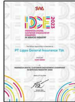
SWA Indonesia 2023